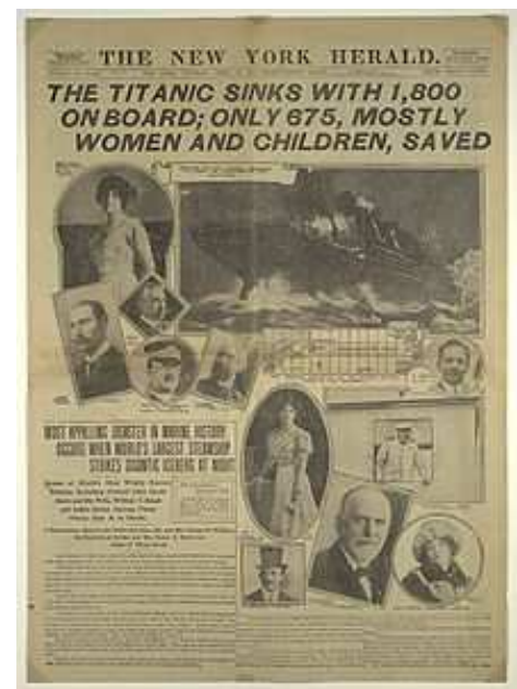
The New York Herald píše o Titanicu.