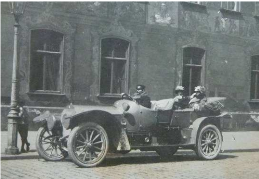
Na cestách v Stuttgarte.

Tento kočiš k odmeneným a obdarovaným asi nepatrí. Kočiši sa v tej dobe zrejme na funkciu šoféra určite nehrnuli, s autom teda do Kovariet prišiel aj šofér. Bol Francúz a na novom pôsobisku sa mu nepracovalo zvlášť ľahko. Snažil sa niečo naučiť aj po slovensky, slovenčina mu však robila dosť veľké problémy. Najspokojnejší bol, keď sa madam vypravila na niektorú zo svojich ciest po Európe. Veľakrát navštívili Viedeň, počas vojny často cestovali do Budapešti, ocitli sa v poľskom Kolomere, zachovali sa fotografie z bavorského Schwarzwaldu a Stuttgartu.