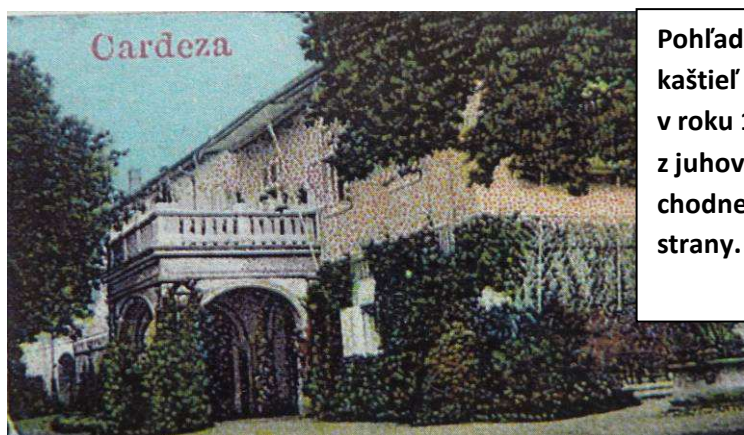
Pohľad na kaštieľ v roku 1911 z juhovýchodnej strany.