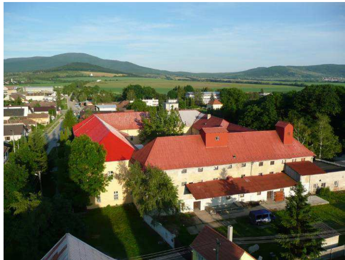
Pohľad z veže kostola na kaštieľ v roku 2010.

Na spríjemnenie pobytu v kaštieli slúžila panstvu aj kolkáreň, kde skúšali svoju šikovnosť a presnosť triafaním kolkov. Ďalšou módnou a aj prestížnou zábavou v kaštieli bolo korčuľovanie na kolieskových korčuliach. Vec to bola v našich končinách nevídaná, v Amerike si však už v roku 1876 nechal konštruktér William Brown patentovať dvojradowé kolieskové korčule podobné tým dnešným. Materiálovo i konštrukčne mali najväčší vývin pred sebou, asfaltové cesty a betónové plochy do Kovariec zatiaľ nedorazili, ale vydláždené chodby a sály rozsiahleho kaštieľa poskytovali dostatok priestoru na ukážky amerického spôsobu života služobníctvu a samozrejme aj konzervatívnejšie naladeným jednotlivcom vidieckej šľachty. Začiatkom 20. storočia začali byť kolieskové korčule veľkou módou. Hral sa na nich hokej, pólo a objavilo sa aj krasokorčuľovanie. Obrovským fanúšikom korčúľ bol aj Charlie Chaplin, ktorý v roku 1916 natočil film The Ring , kde predvádza krasokorčuľarske kreácie.